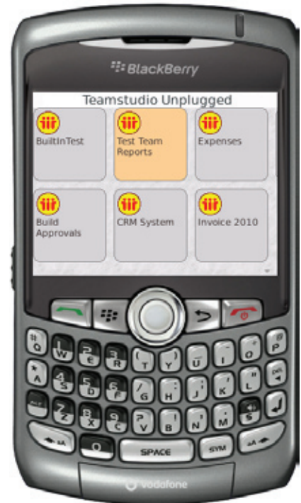
Teamstudio Unplugged equipa al usuario final con una interfaz fácil de usar desde el principio

Los problemas de conexión y ancho de banda se reducen en gran medida ya que Teamstudio Unplugged permite acceder directamente a aplicaciones de Notes y almacenarlas en un dispositivo BlackBerry.